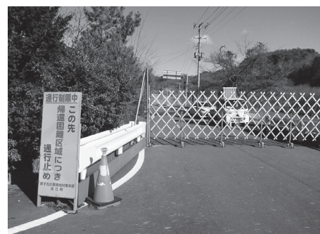
浪江町津島地区側のバリケード。飯館村長泥までの10数キロが再開になる

避難指示解除が予定される今年春の連休前後になれば、峠をうねりながら下る「いろは坂」は桜が満開になる。「これまで支援してくれた仲間たちに見せたくてなあ」。